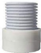
Forlængerrør til type: A, B, D, E, F, G, H