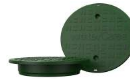
Dæksel til type: J, K