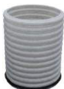
Opføringsrør til type: A, B, D, E, F, G, H