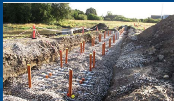
Etablering af DPF anlæg i Allerød kommune (Lyngby Nord)